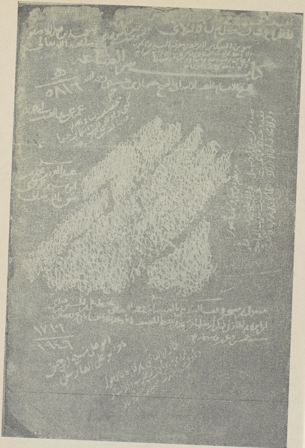
الصفحة الأولى من نسخة ص «الصمصائية» ، وهي أقدم النسخ التي بأيدينا .