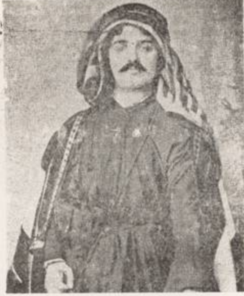
عبد القادر الخرساء بلباسه العربي

ولد الشهيد في مدينة دمشق سنة ١٨٨٥ م واسرة الخرساء دمشقية الأصل تقطن في حي القيمرية ، تلقى