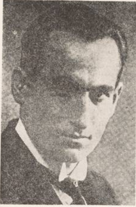
الفدائي البطل صوغمون تهرليان

واكب على الالمانية يتعلم لغتها ، وكان بالوقت ذاته يراقب طلعة باشا مدة طويلة ، فقابله مرة في احدى الجناين فعرفه من صورة الشمسية التي زوده بها الحزب ، وتبعه حتى استدل على البيت الذي يسكنه ، واستأجر منزلاً يقابلة وبات يراقب حركاته وسكناته وساعات خروجه واياه ، وفي يوم ١٥ آذار سنة ١٩٢١ م خرج طلعة باشا من منزله لوحده وسار في شوارع برلين ، فلحقه وأسرع فتخطى الشارع الذي يقابله ، ثم أتى اليه وجهاً لوجه ، وأطلق عليه رصاصة واحدة من مسدسه ، فخر صريعاً ، ووقف القاتل ينظر وقد ضاع رشده ، ثم انسل من بين الجموع ورسم بمسدسه وفرن هارباً ، فهجم المارون عليه بضربونه ، فوقع على الارض وغاب عن وعيه ، فأتت الشرطة واوقفته ، وقد تطوع كثير من كبار المحامين الالمان والارمن للدفاع عنه ، وتداخلت الاحزاب الارمنية لانفاذه ، وبعد المحاكمة قررت عدم مسؤوليته بسبب المذابح التي تعرضت لها أسرته ، فأطلق سراحه وعاد الى امريكا . وقد دفن طلعة باشا في مقابر برلين .