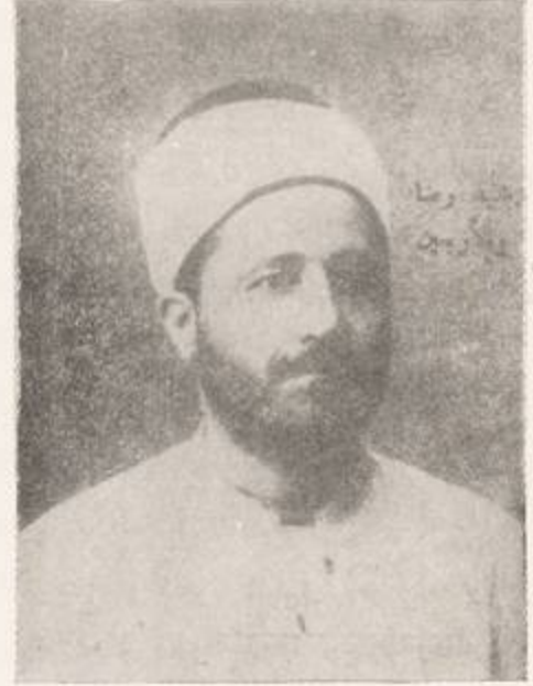
صورة الامام فقيه الاسلام في شبابه

مولده ونشأته - . ولد في قرية القلمون شمالي لبنان في اليوم السابع من شهر جمادى الاولى سنة ١٢٨٢ هـ وتشرين الاول سنة ١٨٦٥ م من اسرة السادة الاشراف ، وقد امتاز اهل بيته بالعلم والصلاح والرياسة ، وكانوا يلقبون بالمشايع .