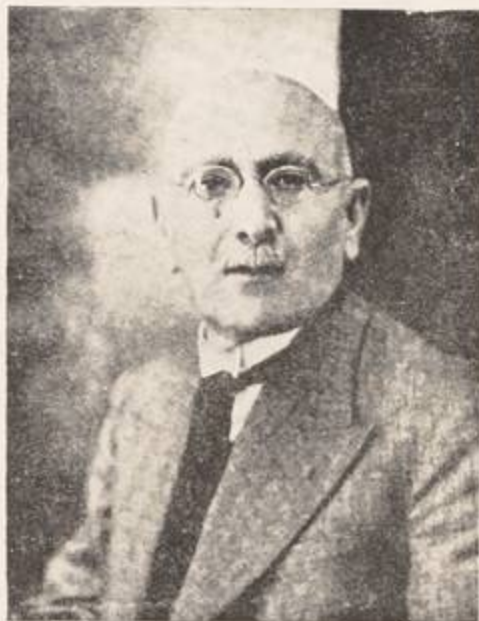
العلامة المرحوم محمد كرد علي ١٨٧٦ - ١٩٥٣