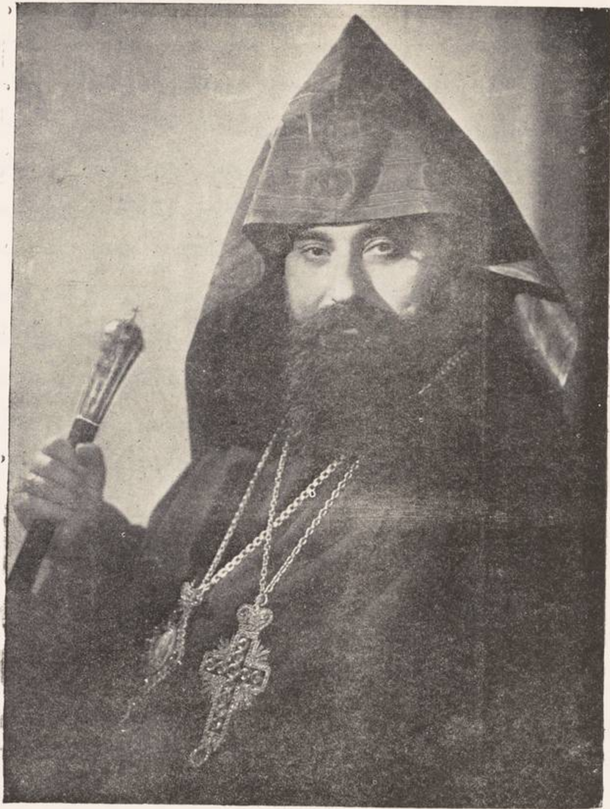
قداسة الكاثوليكوس زاره الاول كاثوليكوس و بطريرك الارمن الارثوذكس في الاقليم السوري ولبنان وقبرص