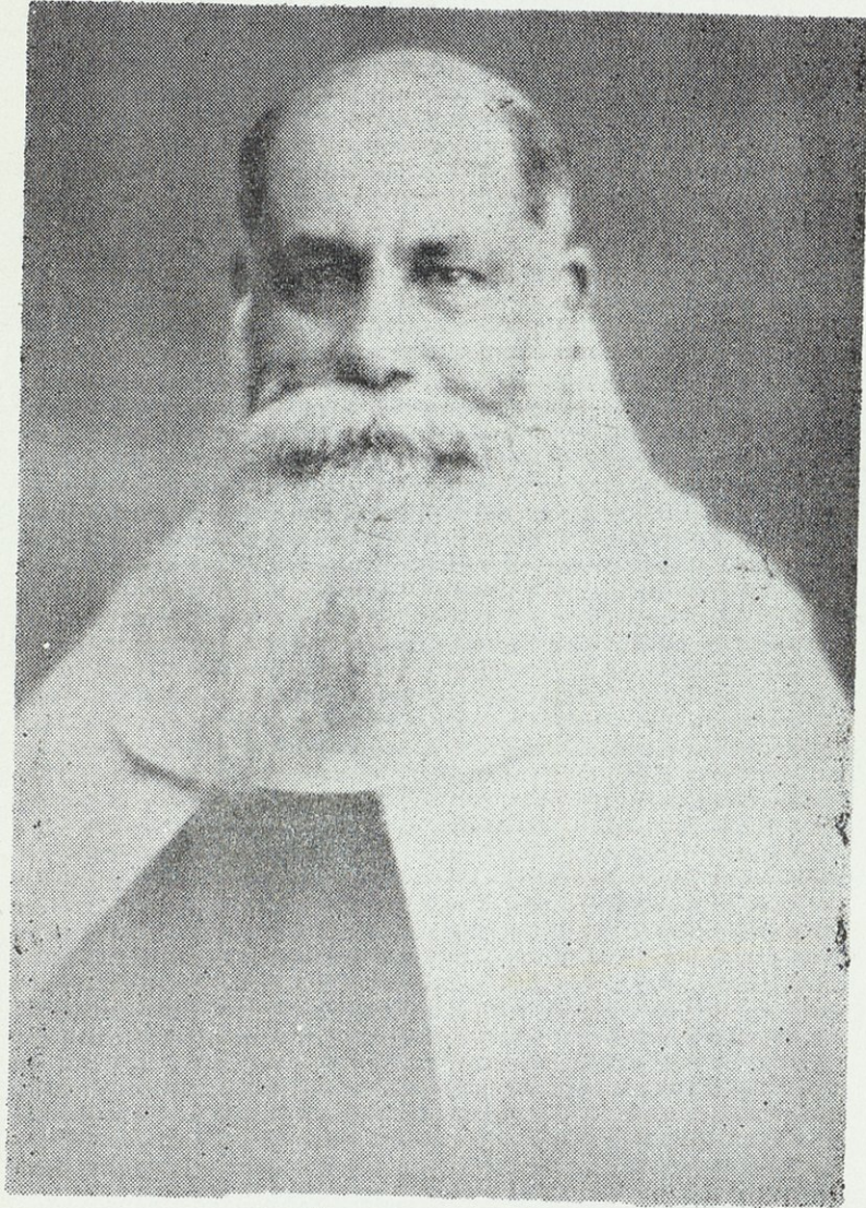
الاب انستاس ماري الكرملني ( ١٨٦٦ - ١٩٤٧ )