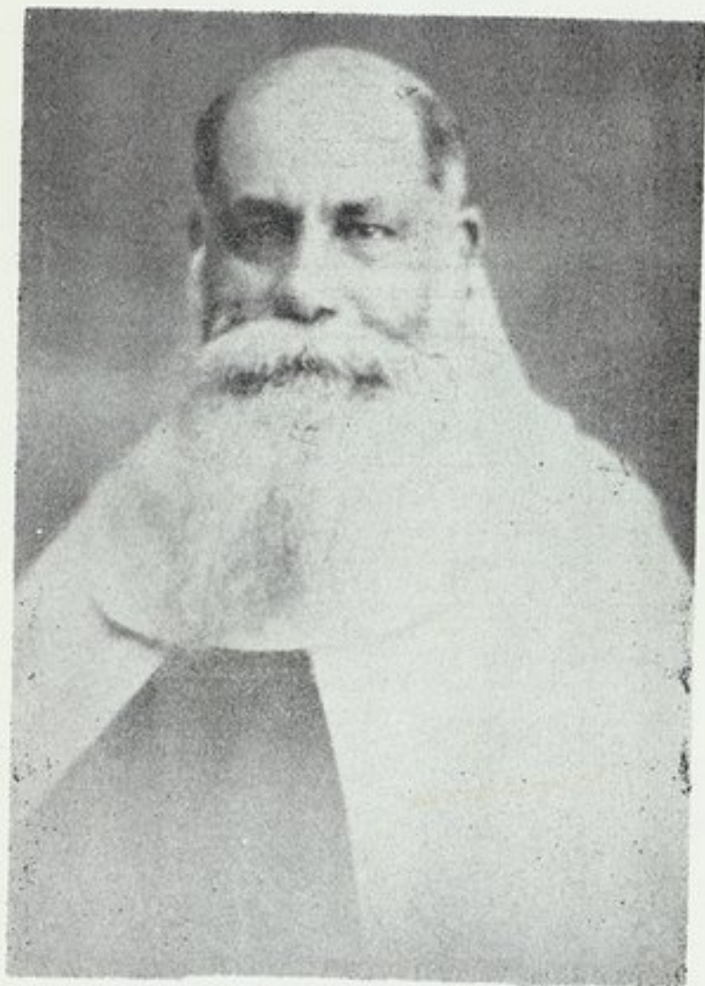
الاب انستاس ماري الكرملی ( ١٨٦٦ - ١٩٤٧ )